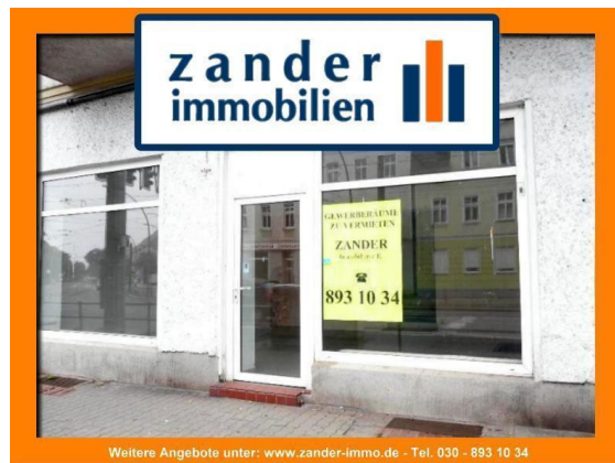
Weitere Angebote unter: www.zander-immo.de - Tel. 030 - 893 10 34