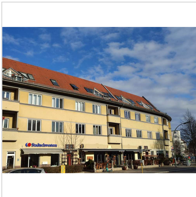
Umfeld zeigt nicht das Objekt