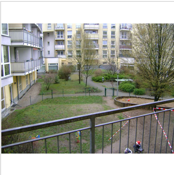
Blick in Hof

Zimmer: 2,00 Wohnfläche ca.: 70,02 m 2 Kaltmiete: 673,92 EUR (zzgl. Nebenkosten) Gesamtmiete: 893,92 EUR