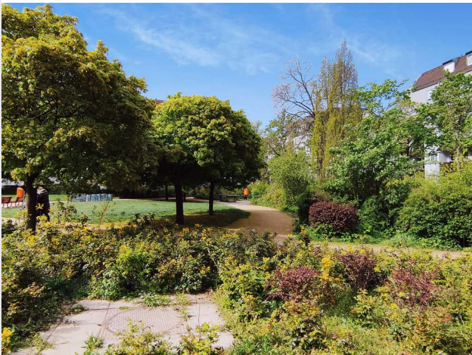
Umfeld zeigt nicht das Objekt