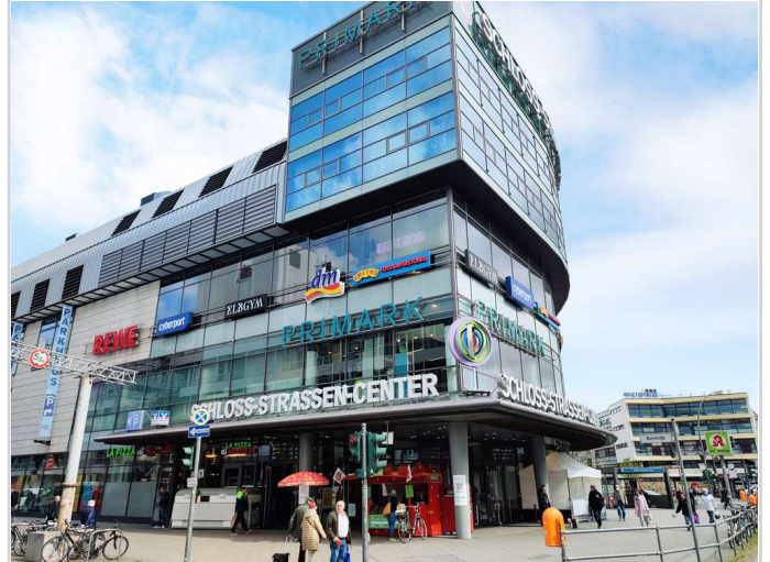
Umfeld zeigt nicht das Objekt