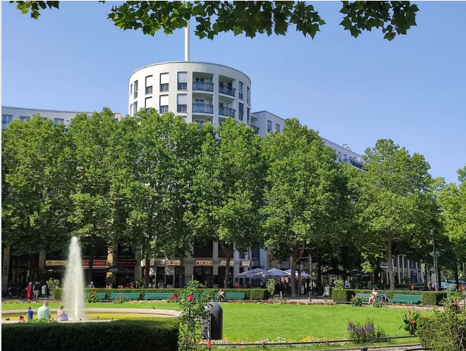
Umfeld Prager Platz

Miet-/Kaufobjekt: Miete Verkaufsfläche: 60,00 m 2 Gesamtfläche: 86,00 m 2 Miete pro Monat: 2.500,00 EUR